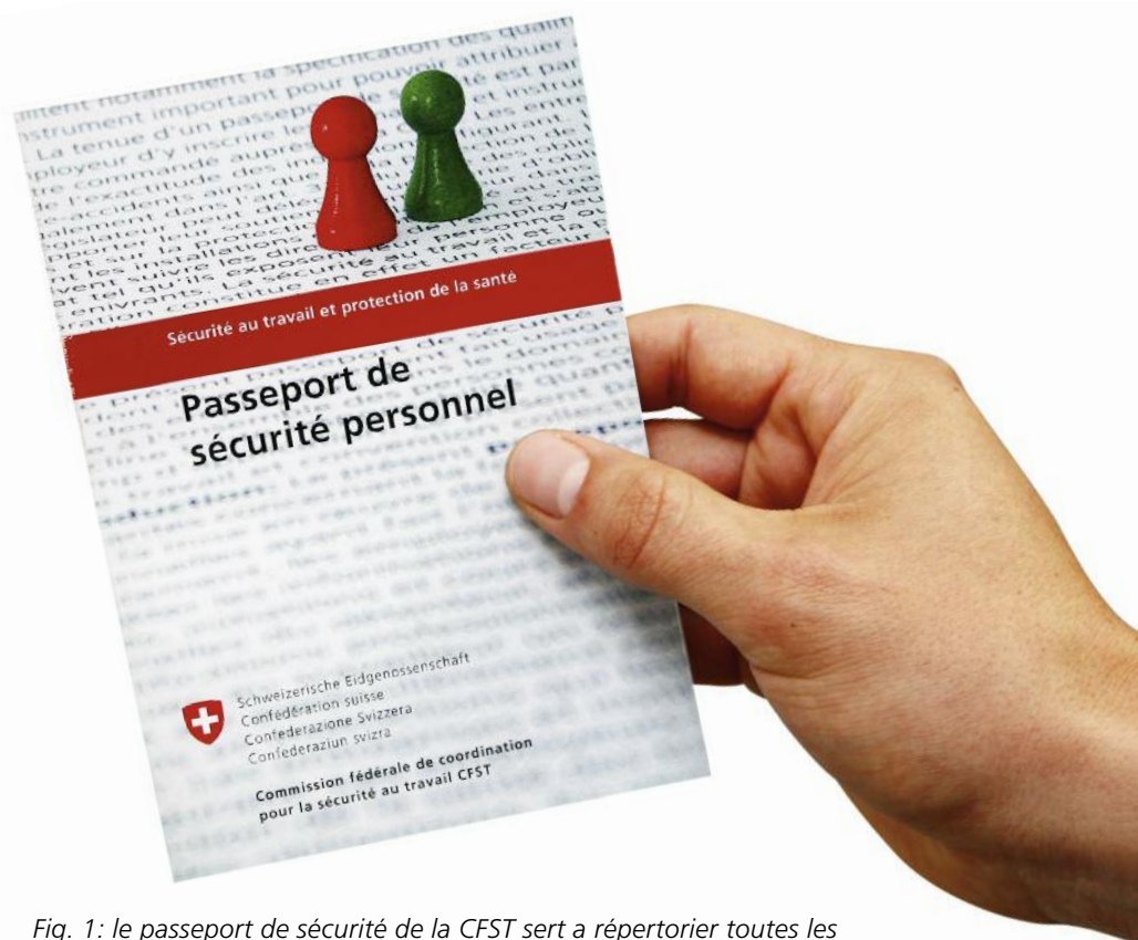
Fig. 1: le passeport de sécurité de la CFST sert à répertorier toutes les formations et instructions pertinentes suivies dans le domaine de la sécurité au travail et de la protection de la santé.

Le passeport de sécurité de la CFST sert à répertorier les instructions et les formations accomplies dans le domaine de la sécurité au travail (ST) et de la protection de la santé (PS) au poste de travail. Le passeport de sécurité personnel de la CFST offre un bref aperçu du niveau de préparation des travailleurs aux plans de la sécurité au travail et de la protection de la santé et permet de prendre les mesures nécessaires afin de réduire les risques d'accidents professionnels. En cours de mission, l'entreprise locataire de services demeure toutefois tenue de contrôler régulièrement la mise en œuvre des connaissances indiquées.