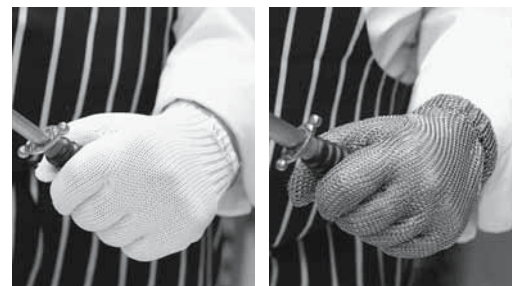
Figures 3 et 4: gants de protection anticoupure: gants métalliques ou en téflon.