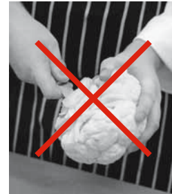
Figure 9: incorrect : parer sans support.