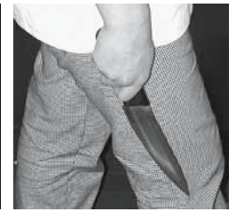
Figure 8: correct : pointe du couteau dirigée vers le bas.