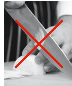
Figure 11: incorrect : couteau trop haut.