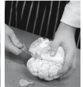
Figure 10: correct : parer sur une planche de découpe.