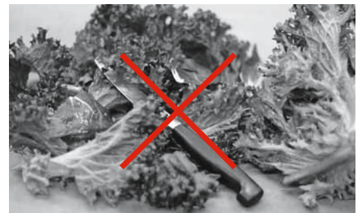
Figure 14: incorrect : couteau laissé dans la salade parée.

Si vous avez constaté d'autres dangers concernant ce thème dans votre entreprise, notez également au verso les mesures qui s'imposent.