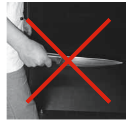
Figure 7: incorrect : pointe du couteau dirigée vers l'avant.