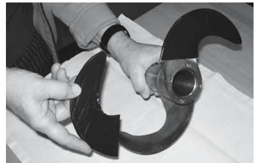
Figure 2: protecteurs des lames de coupeuses.