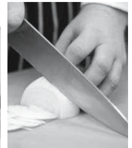
Figure 12: correct : doigts protégés.