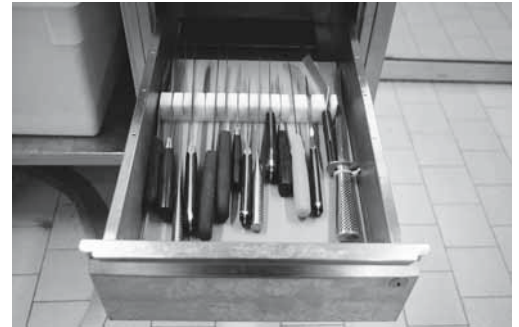
Figure 1: rangement correct des couteaux.