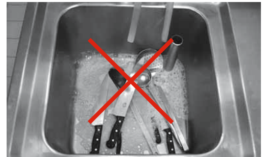
Figure 13: incorrect : couteaux laissés dans l'évier.