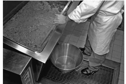
Bild 1: Bodenebene und rutschhemmende Roste verhindern Ausrutsch- und Stolperunfälle.