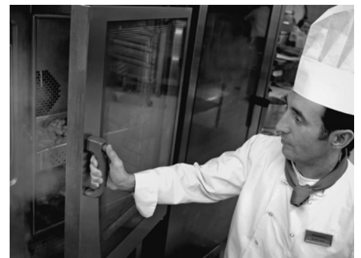
Bild 7: Wenn sich die Person beim Öffnen der Türe richtig hinstellt, dient die Türe auch als Schutz gegen das Verbrühen.