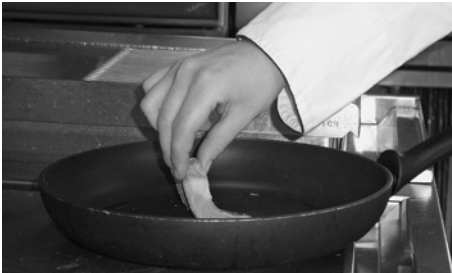
Bild 10: Vom-Körper-weg-Einlegen des Fleisches schützt vor heissen Spritzern.