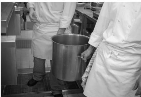
Bild 12: Schwere Pfannen zu zweit tragen.