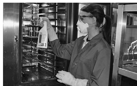
Bild 18: Die Schutzmaske Typ FFP2 verhindert das Einatmen von Aerosolen (Tröpfchen) des Sprühnebels des Reinigungskonzentrates.