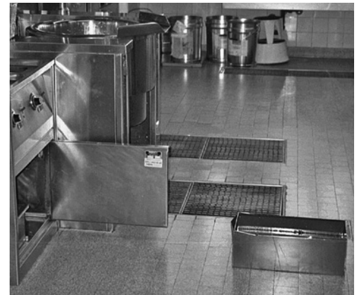
Bild 6: Dieser Behälter mit Frittieröl bildet eine gefährliche Stolperstelle.