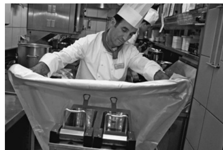
Bild 17: Löschen eines Fritteusenbrands. Körper und Hände bleiben dabei geschützt.