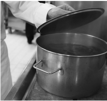
Bild 9: Korrektes Abheben des Pfannendeckels schützt vor Spritzern und Verbrühen.