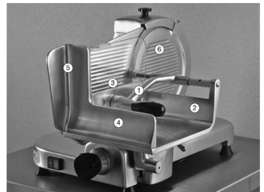
Bild 2: Aufschnittschneidemaschine mit den erforderlichen Schutzeinrichtungen. Schnittguthalter (1), am Schlitten (2) unlösbar, aber aufschwenkbar befestigt; Schutzplatte (3); Schlitterückwand (4) und Fingerschutz (5); verriegelte Messerverdeckung (6), d. h. bei Entfernen der Verdeckung wird der Motorstrom unterbrochen.