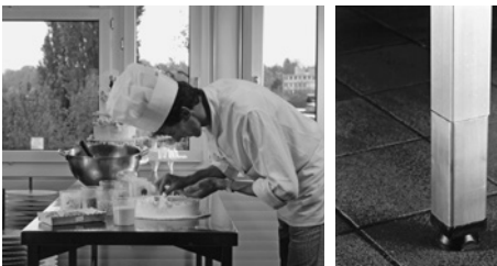
Bild 13 und 14: Ein zu tiefer Arbeitstisch schadet dem Rücken. Eine einfache Verlängerung der Tischbeine kann Abhilfe schaffen.