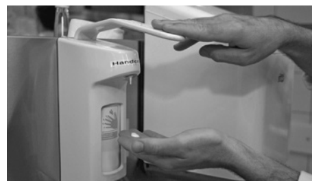
Bild 19: Die konsequente Verwendung von rückfettenden Desinfektionsmitteln und Hand- schutzcremen verhindert Hautschäden.