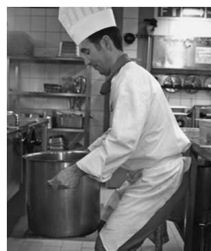
Bild 20: Korrektes Heben mit geradem Rücken und wenn möglich zu zweit.

Es ist möglich, dass in Ihrem Betrieb noch weitere Gefahren zum Thema dieser Checkliste bestehen. Ist dies der Fall, treffen Sie die notwendigen Massnahmen (siehe Rückseite).