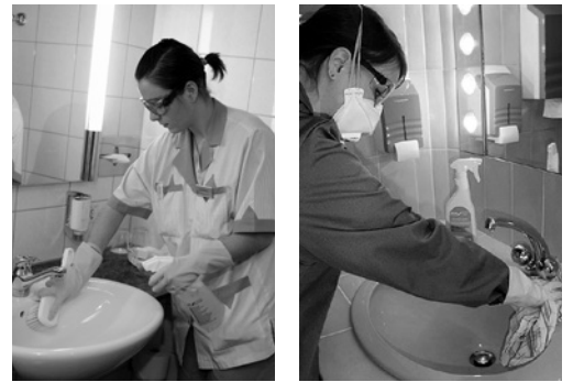
Bilder 6, 7: Korrektes Arbeiten mit säurehaltigem Entkalkungsmittel. Die Schutzmaske kommt bei ungenügender Lüftung zum Einsatz.