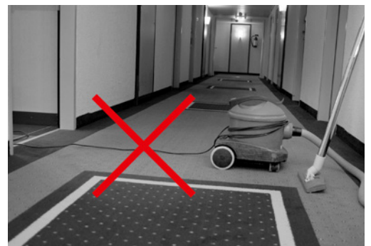
Bild 8: Quer durch Korridore führende Stromkabel bilden gefährliche Stolperstellen.