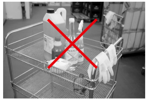
Bild 5: Um Verwechslungen und Vergiftungen zu vermeiden, sollen nur Originalgebinde verwendet werden.