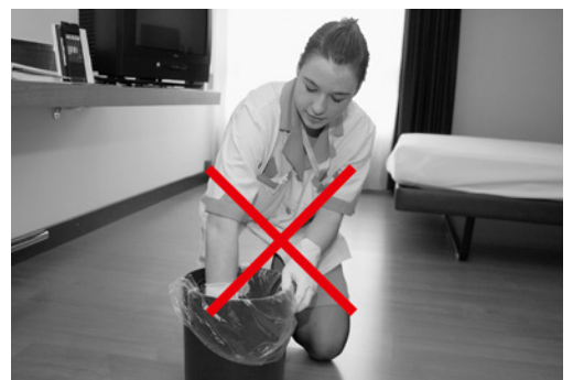
Bilder 3 und 4: Man schützt sich vor Verletzungen, indem man Plastiksäcke in die Abfallkörbe einlegt, die Abfallsäcke lose transportiert und den Abfall nicht zusammendrückt.